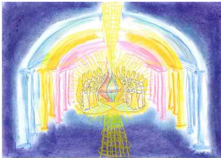
Herztempel im Schnitt

Unzählbar viele Wesen der Geistigen Welt begleiten uns auf dieser Welle. Sie werden uns jene Wunder offenbaren, die geschehen, wenn wir uns mitfühlend und liebevoll den Wunden anderer Menschen zuwenden