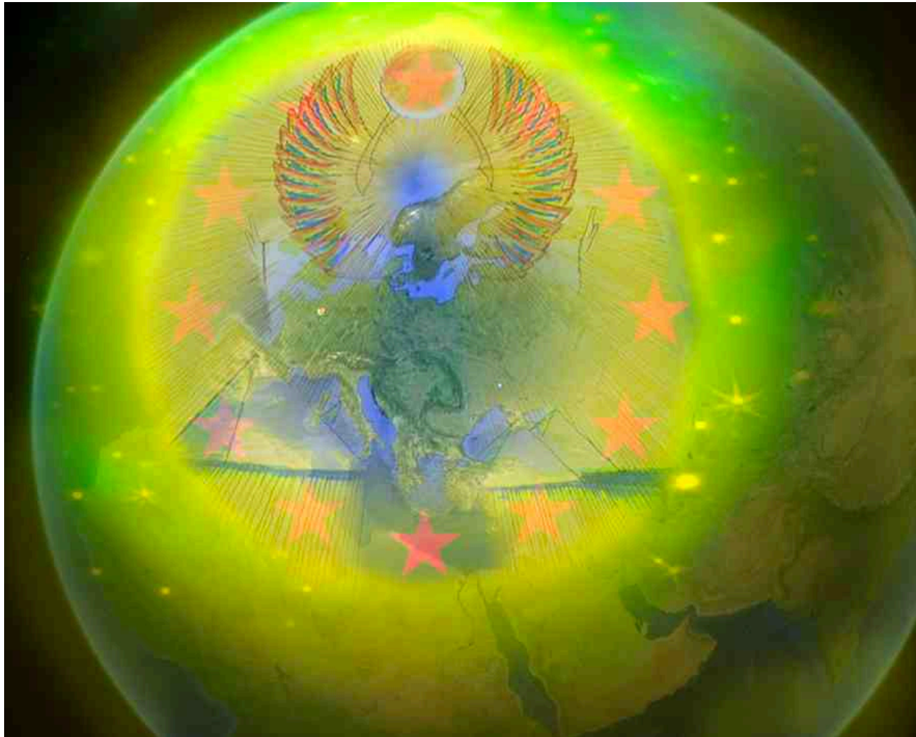
Raum-Zeit-Seelen-Reinigung der Europawahl 2014 mit Isis und Thoth