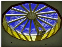
Das Dach über der zentralen Halle